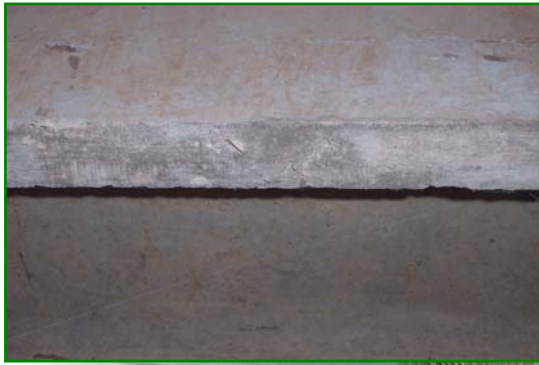
Aspect de la nervure avant ponçage