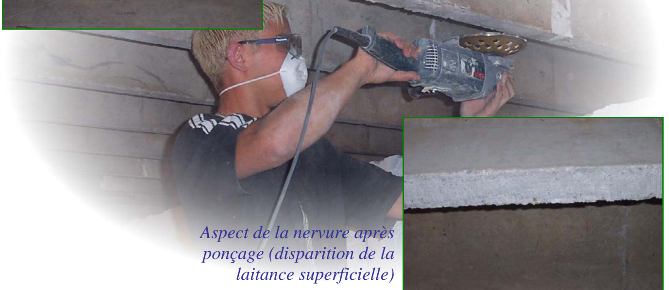
Aspect de la nervure après ponçage (disparition de la laitance superficielle)