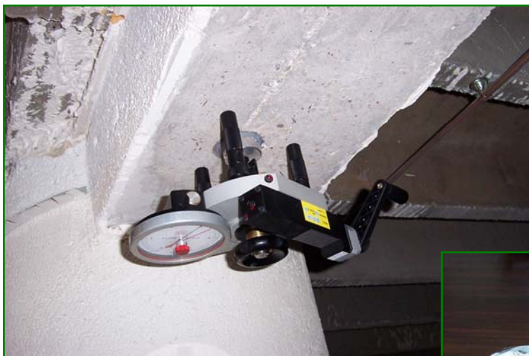
Essai d'adhérence du béton à l'aide du « Dynamomètre » La pastille est collée 24 heures avant l'essai