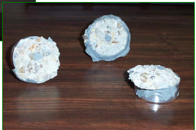
Pastilles après les essais de traction. La cohésion superficielle du béton doit être supérieure à 1,5MPa soit 2,94 kN