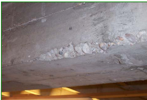
Epaufiture sur une poutre principale