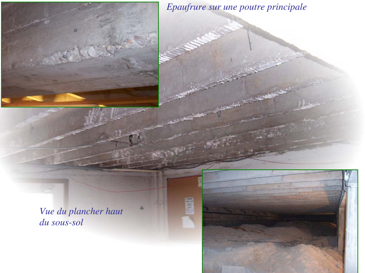
Vue du plancher haut du sous-sol